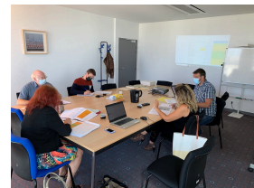
Réunion préparatoire septembre 2021